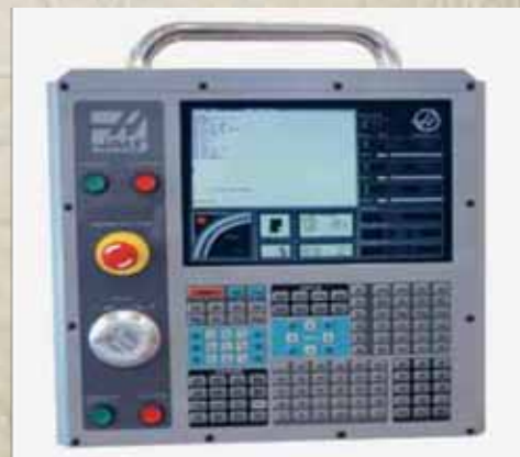
UPRAVLJAČKE JEDINICE HAAS - SIMULATORI-