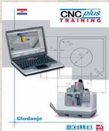
CNC GLODALICA HAAS TM-2P

Oprema u SREDNJOJ ŠKOLI LUBREG u sklopu Strukovnog Centra Izvrsnosti iz Strojarsstva i HAAS/HTEC tehnološko - edukacijskog centra