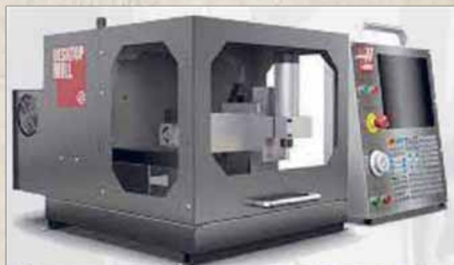
HAAS DESKTOP GLODALICA ZA OBUKU POČETNIKA