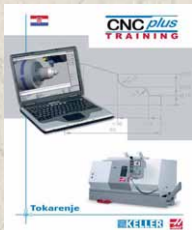
CNC TOKARILICA HAAS TL - 2