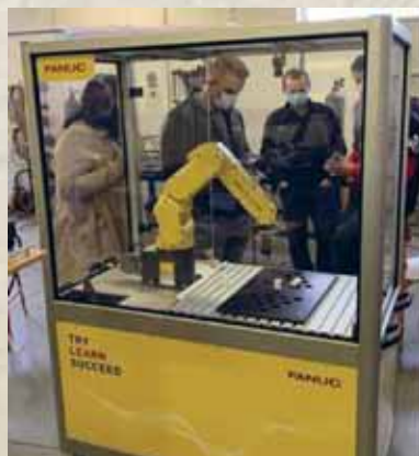
ROBOTSKA RUKA FANUC