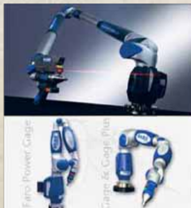
3D MJERNA RUKA FARO